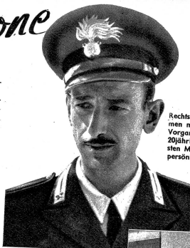
Der Polizist soll die ruhige Abwicklung der Wahl überwachen. Er hat nicht viel zu tun, da es bei der kleinen Bevölkerung keinen Andrang gibt.