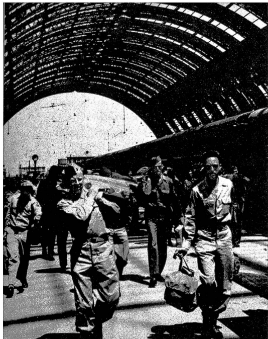
Aus allen Richtungen kommen die Leute in Mailand an: Freudig ihre Gesichter, denn nun geht's nach Hause. Im gleichen Mailänder Bahnhof reisen auch die Urlauber nach der Schweiz ab — denen pressiert's nicht so, nach Hause zu gehen!