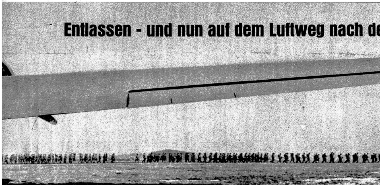
Links: Hunderte marschieren nach ihren Transportmaschinen