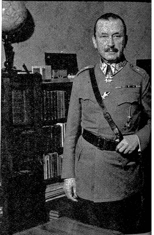
Links: Auf den Alandsinseln wird immer am 23. Juni, zur Sommersonnenwende, eine solche Stange geschmückt. — Unten: Ein typischer Fischer vom Norden Finnlands. — Rechts: Der Marschall von Finnland, Baron C. G. Mannerheim, der während der Kriegsjahre und noch heute eine führende Rolle spielt