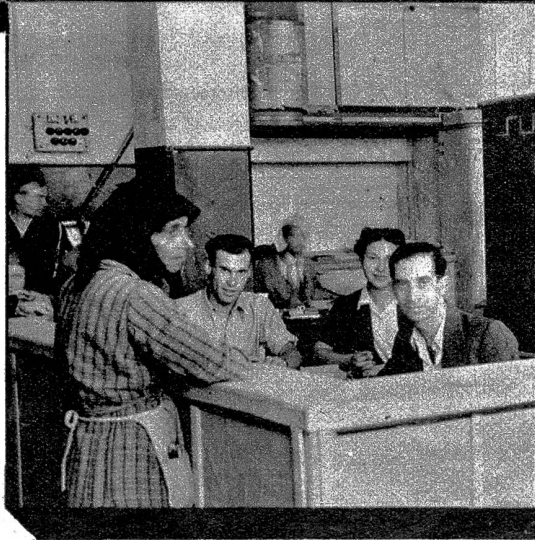
Oben: Ein mit Lebensmitteln, Medikamenten und Kleidern beladener Dampfer des Internationalen Komitees vom Roten Kreuz kommt in Athen an. Links: Die Zollabfertigung auf dem Dampfer geht rasch vonstatten. Mitte: Die griechische Bevölkerung steht Schlange, um ihre Lebensmittel auf der Delegation des Internationalen Komitees vom Roten Kreuz zu holen. Rechts: Die Rotkreuz-Lebensmittelpakete werden vor den hungrigen Augen der griechischen Kinder geöffnet, und bald erhält jedes seine Ration. Unten: Auf der Delegation des Internationalen Komitees vom Roten Kreuz werden die Namen der Lebensmittelbezügler eingetragen

Mit dieser heute abgeschlossenen Griechenlandaktion, die sich zahlenmäßig ausgedrückt auf 260 000 Tonnen Korn, 7600 Tonnen Milchkonzentrate = 11 Millionen Schweizerfranken, belief, hat das Internationale Komitee vom Roten Kreuz in Zusammenarbeit mit den nationalen Rotkreuzorganisationen und der Liga der Rotkreuzgesellschaften wohl sein bisher größtes Hilfswerk vollbracht.