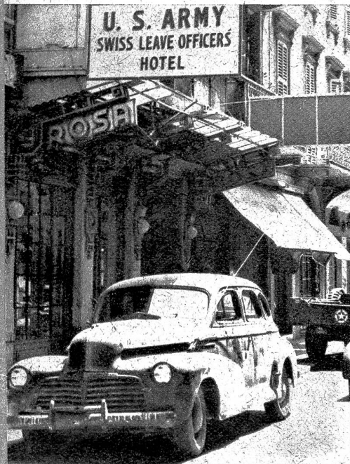
Das Hotel Rosa, in dem sich das Hauptquartier der Amerikaner, Sektion Urlaub in der Schweiz, befindet.