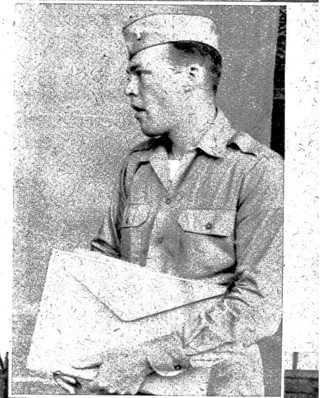
Unten: Eine kurze Gepäckkontrolle im Zollgebäude in Chiasso. Beim Austritt erhalten die Urlauber Mahlzeitencoupons und einige — Schokoladenpunkte