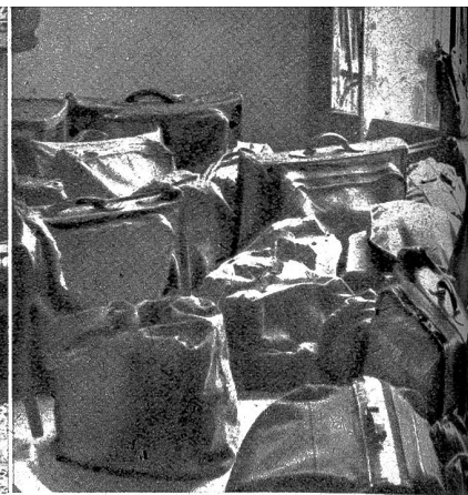
In der Vorhalle des Hotels türmen sich die Gepäckstücke der Urlauber bald zu richtigen Bergen an. Mehr als 400 Mann werden hier jeden Tag durchgeschleust und bald werden es jeden Tag 800 Mann sein.