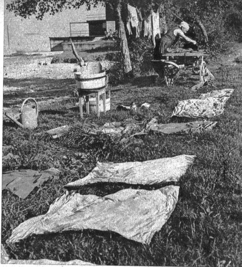
Im Gras und an der Sonne kann die Wäsche gut trocknen und wird schneeweiss