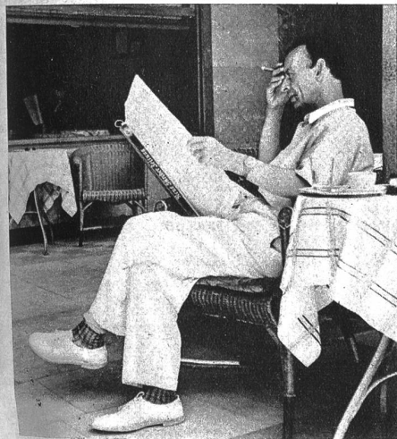
Erst am Abend finden sich langsam die ersten Besucher ein, Aber auch sie sind scheinbar noch nicht recht erwacht und machen noch einen benommenen Eindruck

Dort, in jenem Teil der Schweiz, der am wenigsten hoch über dem Meeresspiegel liegt, befindet sich auch die heisseste Ecke unseres Landes. Mögen sich alle, welche in den übrigen Landesteilen müde und unter der Sommerhitze leidend ihres Weges ziehen, damit trösten, dass in Locarno und Umgebung immer noch mehr Wärmegrade vom Thermometer abgelesen werden können. Im Hochsommer ist Locarno nicht mehr die Stadt des eifrigen Fremdenverkehrs, als welche wir sie kennen und lieben, sondern ein Ort, in dem das Leben träge dahinschleicht und sich schutzsuchend in die kühlenden Steinhäuser oder in die erfrischenden Fluten des Lago Maggiore flüchtet.