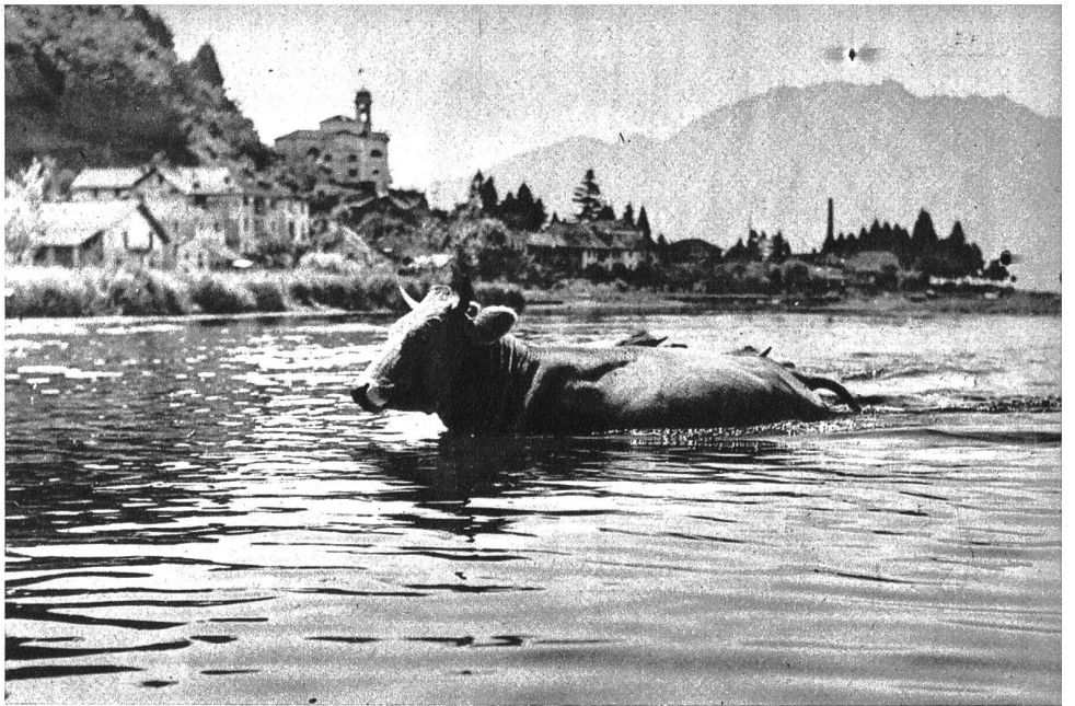
Auch die Kühe kennen in der Magadino-Ebene die wohltuende Wirkung des Wassers

wollte oder nicht — dem Halbschlaf, den die Sonnenglut fördert, hingeben müssen.