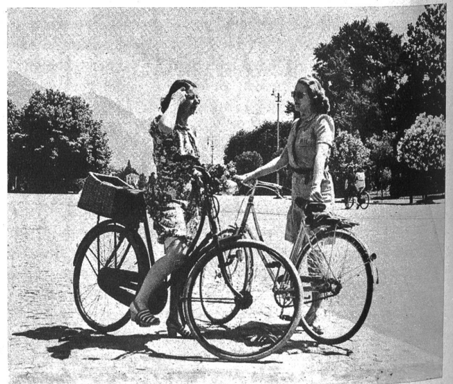
Nur leichtbekleidete Velofahrerinnen begegnen uns — wenn wir Glück haben — um diese Zeit noch auf der Strasse

Links: Glücklich derjenige, der sich in einem Segelboot (und sei es auch noch so klein) hinausflüchten kann auf den kühleren Lago Maggiore. Was tut es schon, wenn die Segel schlaff herabhängen, man kann doch immerhin zu jeder Zeit hineinspringen ins Wasser und seine Erfrischungsmöglichkeiten