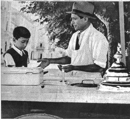
Der „Gelati“-Verkäufer bleibt als einer der wenigen auf seinem Posten und macht, wie es scheint, ganz gute Geschäfte