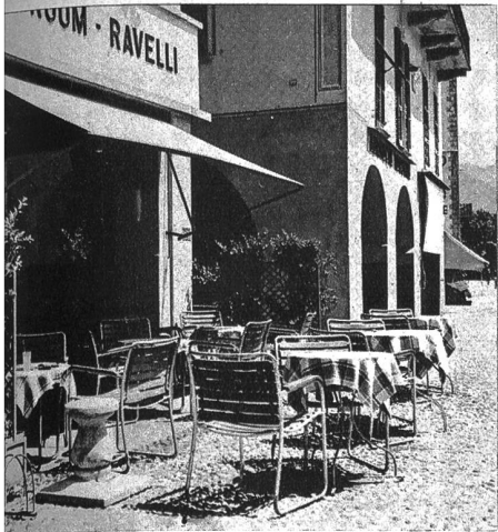
In den Strassen aber ruht jegliches Leben und die appetitlich gedeckten Tische vor den Restaurants warten vergeblich auf Besucher