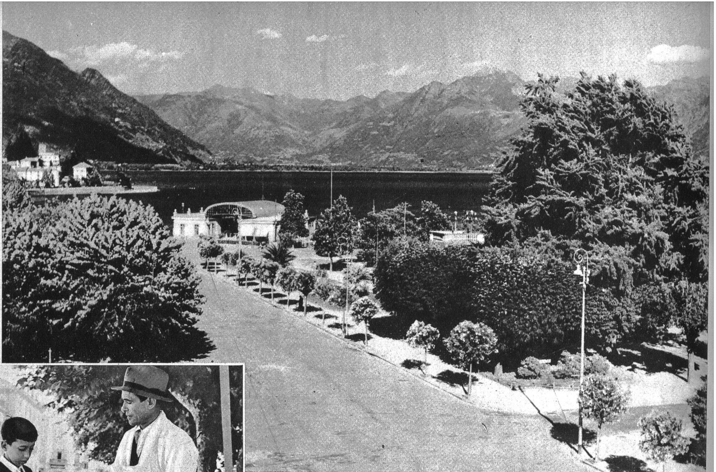
Sommertag in Locarno. Die übersonnten Plätze und Strassen liegen tot und verlassen da. Kein Mensch wagt sich hinaus in die sengende Glut