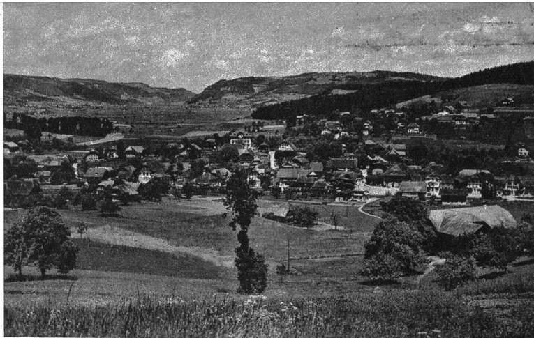
Seftigen, der Hauptort des gleichnamigen Amtsbezirks ist ein schönes grosses Dorf im oberen Gürbetal

Die Kunden vom Obern Gürbetal sind befriedigt von ihren Einkäufen in der