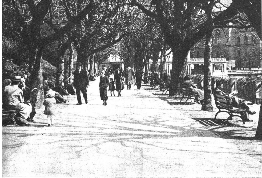
Kein Bankleier der Promenade ist frei...