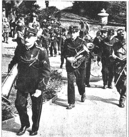
Links: Die Pestmusik kommt angezogen! Rechts: Und hinter der Musik kommen die Leute. Merkwürdig, jeder verspürt ein gehobenes Gefühl, auch wenn er hinter der nichtspielenden Musik hergehen kann...