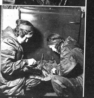
Welches mag der rechte Schlüssel sein?