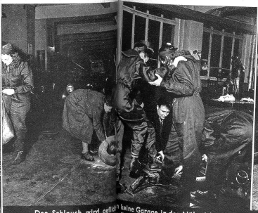
Der Schlauch wird geölt. Keine Garage in der Nähe ist, muss der Schlauch mit der Hand- oder Fusspumpe aufgepumpt werden