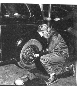
Der Radwechsel hat geklappt