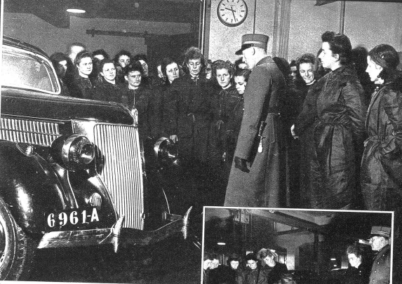
Der Prüfung wohnten militärische Experten bei, die selbst auch Fragen stellten