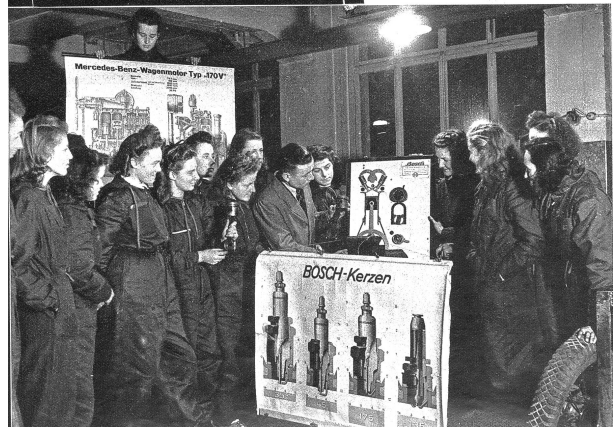
Links: Auch theoretisch muss man die Kerzen genau Bescheid wissen