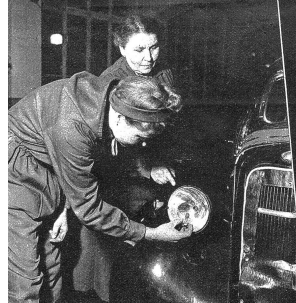
Die Birne des Scheinwerfers wird gewechselt. Hier heisst es aufpassen, dass das Leffel richtig oben ist