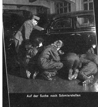
Auf der Suche nach Schmierstellen