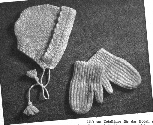
Beschreibung für Käppi

Material: 20 g weisse Babywolle, 1 paar Stricknadeln.