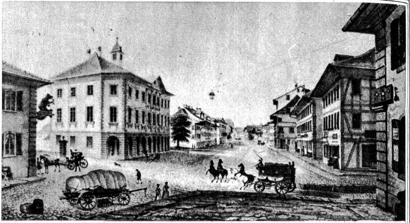
Langenthal ums Jahr 1830. Ankunft der Postkutsche