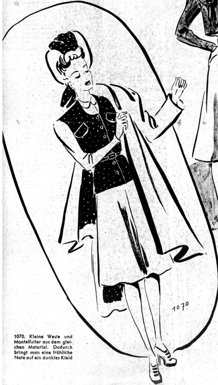
1070. Kleine Weste und Mantelfutter aus dem gleichen Material. Dadurch bringt man eine fröhliche Note auf ein dunkles Kleid

Immer wieder kommt es vor, dass man ein altes Kleid hat, das zwar nicht mehr ganz modern, aber doch noch gut im Stoff ist und das man eigentlich gerne hat und nur ungerne weglegen möchte. Um diese Kleider wieder tragbar zu machen, braucht es oft nur eine Kleinigkeit, die mit wenig Mitteln und ein bisschen Geschick dem alten Kleide ein ganz neues Aussehen gibt. Auf diesen beiden Seiten finden unsere Leser einige Anregungen, die helfen werden, aus dem alten lieben Kleid, ein neues, elegantes zu schaffen.