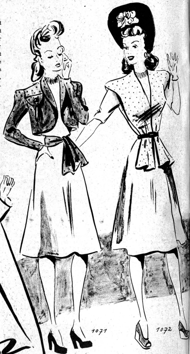
1071. Ein Bolero aus bedruckter Seide und ein gleiches Gürtel dazu geben dem alten Kleid ein ganz neues Aussehen