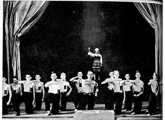
Sprechchor der Bergarbeiter aus dem Bild: Wer ins Mark der Erde dringt. «Wir tragen alle ein Licht durch die Nacht.»