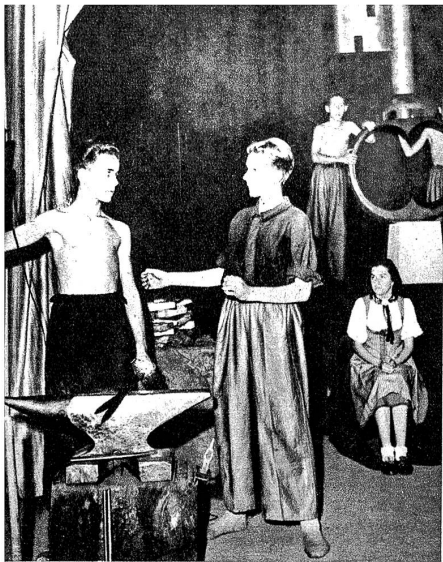
Links und rechts: Hammerlied. Bewegungschor aus dem Bild: Wer den wuchtigen Hammer schwingt. «Nimmer schmiege ich an der andern Glücke, schlage diese karge Welt in Stücke.»