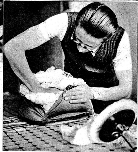
Rechts: Das Verpacken des Fallschirmes