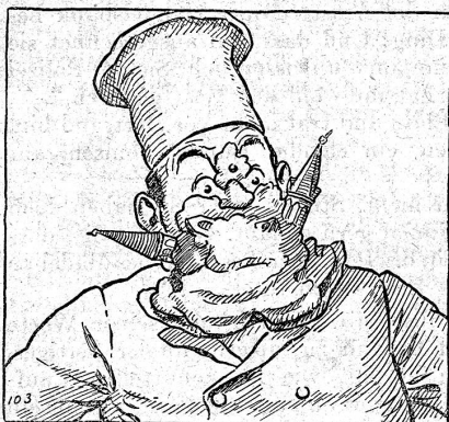
103. Als Herr Blätterteig sich wieder aufrichtete, sass das ganze Schloss wie eine formlose Masse an seinem Gesicht geklebt, nur die Turmspitzen standen noch wie die Spitzen eines riesigen Schnurrbartes in die Höhe. Ja, wenn der Mann sich, so wie er jetzt aussah, in seine Auslage gesetzt hätte, hätte er bestimmt den ersten Preis davongetragen! Dass Peter aber Prügel bekam, das kapiert ihr!

von G. Th. Rotman (Nachdruck verboten) 17. Fortsetzung