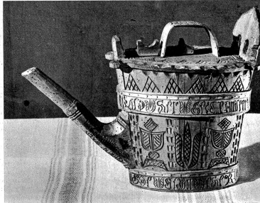
Rechts: Weingelbe aus dem Oberland

Im Rahmen der Schweizer Kunstwochen wurde am 16. Mai in der Kunsthalle Bern eine Schau der historischen bernischen Volkskunst eröffnet. Es ist dies für unsere Kantone die erste derartige Veranstaltung und dürfte für weite Kreise ein eindrucksvolles Ereignis werden. Volkskunst war früher vor allem Bauernkunst. Der bäuerliche Geist und die bäuerliche Lebensführung bilden ihre Grundlage. Träger der Volkskunst war in erster Linie der Handwerker und nur ausnahmsweise der Bauer selbst. Wohl zum Teil vergriffen, was die bernische Volkskunst hervorgebracht hat, gehört die Befähigung des einfachen Volksgenossen mit dem Meister. Jahrhundertlange Herbitmittelmotive erlebten sich hier bis in die Neuzeit auf den Trüben und Hüben, Kreisläufen und Gschlitzeln aus feinstem Bergahol.