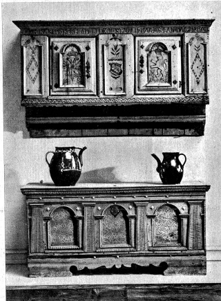
Rechts: Geschmaltzer Wandschrank und Truhe aus dem Oberland