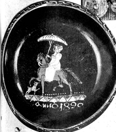
Rechts: Schrankfüllung aus Lys-Rapperswil Kreis: Heimberger Platte aus dem Jahre 1820

Die Menge zerstreute sich, und niemand ahnte, dass dieser luxuriöse Frunkgalast, dieses technische Wunder, nun bereit, zur letzten Ausfahrt, der Vernichtung entgegen. Ein Zeitdokument, Macht der Materie, aber auch mahnendes Beispiel der Vergänglichkeit.