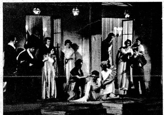
Simone fällt beim Anblick seiner Untreue in Ohnmacht; das Fest bricht jäh ab

Mit diesem bedeutenden Werk des Schweizer Komponisten hat das Stadttheater seinen ersten Beitrag zur „Schweizer Kunst in Bern“ herausgebracht. Diese Oper aus dem Jahre 1919 nimmt in Schoecks Operschaffen einen ersten Rang ein; sie ist das leidenschaftliche Bekenntnis einer Künstlerseele, die, in der Inbrunst der Schönheit befangen, das wirkliche Leben vergisst und sich in dieser Todesliebe verzehrt