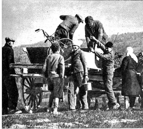
Als besonders wichtig für ein rasches Vorrücken, hat der Nachschub immer zur richtigen Zeit, am richtigen Ort zu sein