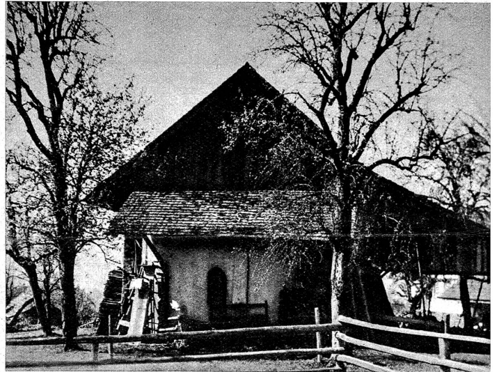
Unter dem Vordach befindet sich der nach Osten gerundete Chor