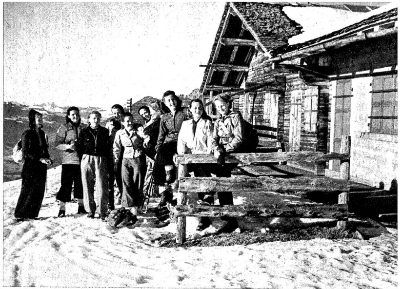
Frohe Rast auf der Abfahrt