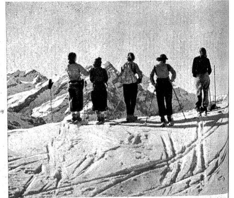
Aussicht vom Truttlisbergpass

Es ist ebenso selbstverständlich, dass einer der Grundsätze, die für die Durchführung eines Skilagerns massgebend sind, der möglicher Einfachheit ist. Auch in oberen Mittelschulen, besonders aber in städtischen Primarschulen, muss Rücksicht