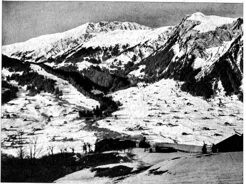
Winterlandschaft bei Lenk