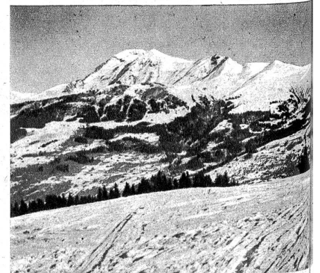
Albristhorn und Laveygrat