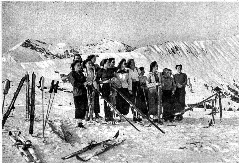
Auf der Mülkerplatte