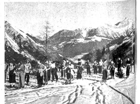
Rechts: Im Aufstieg zum Betelberg