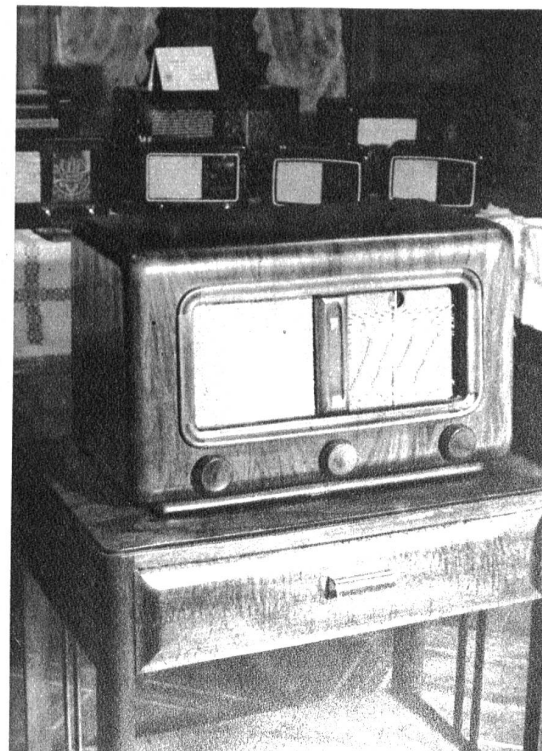
Ein schönes Modell, mit besonders dazu hergestelltem Möbelstück, im heimischen Stil gehalten