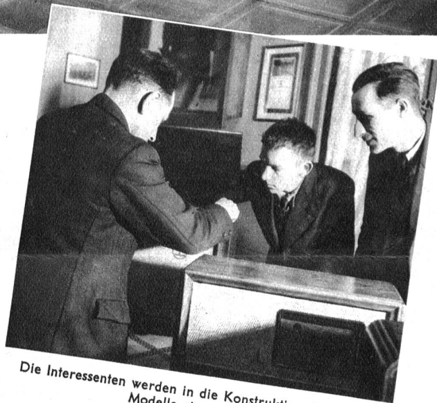
Die Interessenten werden in die Konstruktion der neuen Modelle eingeweiht

Das Handwerk und besonders das Radiohandwerk und der Radiohandel haben es gewiss nicht leicht, sich klar durchzusetzen. Um so bemerkenswerter ist es, wenn man plötzlich einer Radioausstellung begegnet, die ihren Standort zeitweise wechselt. Der Interessent vom Lande hat den Vorteil, mit neuesten Modellen bekannt zu werden, auch steht ihm die Möglichkeit zu, in einem Zeitpunkt, wo er seine Freizeit genießen kann, sich in alle Geheimnisse dieser modernen Errungenschaft einweihen zu lassen. Von seinesgleichen wird er mit der Manipulation vertraut gemacht und ausserdem kann er an Ort und Stelle dasjenige Modell für sich auswählen, welches für seine Verhältnisse am geeignetsten erscheint. So hat eine gute Idee — ein Radio geht auf die Reise — ihre gesunden Früchte gezeitigt.