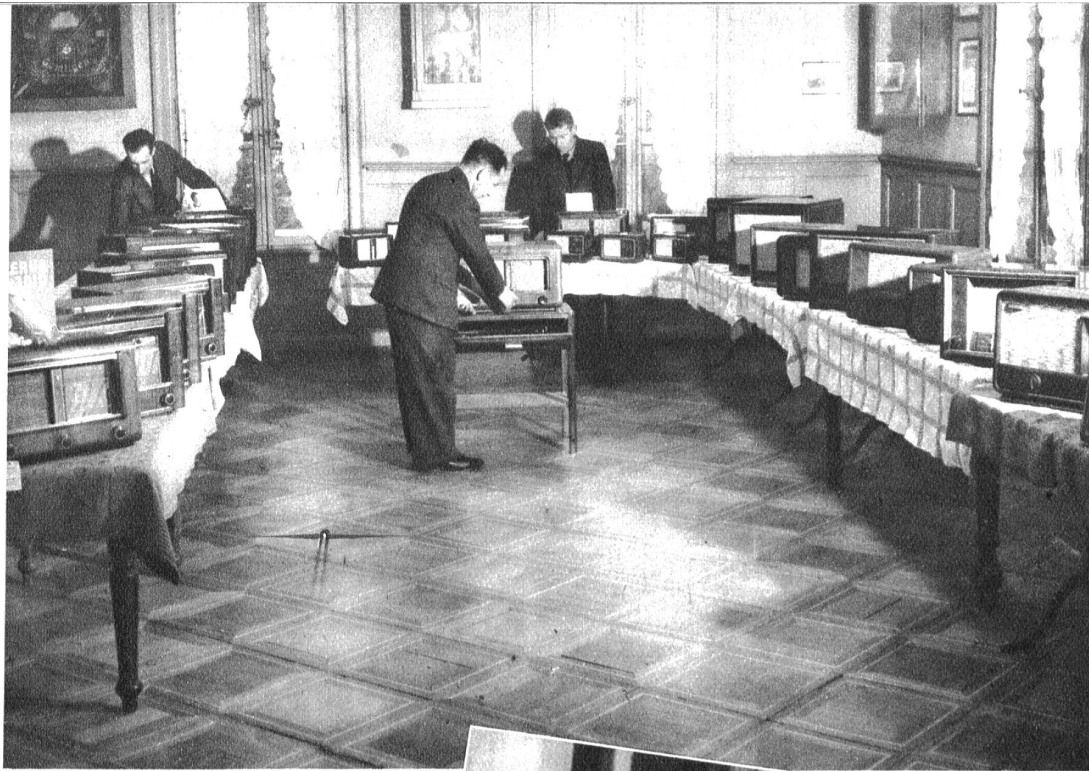
Ansicht der Ausstellung in Gümligen

Man muss sich zu helfen wissen, lautet eine einfache Regel, nur sagt gewöhnlich eine solche Regel nicht deutlich, wie man sich behelfen soll, wenn die Zeiten, wie die unsrigen, Sorgen auf Sorgen an den Mann häufen.