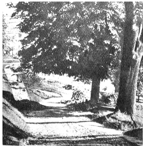
Der obere Schlangenrain, von dem aus der neue Fussweg gebaut wurde