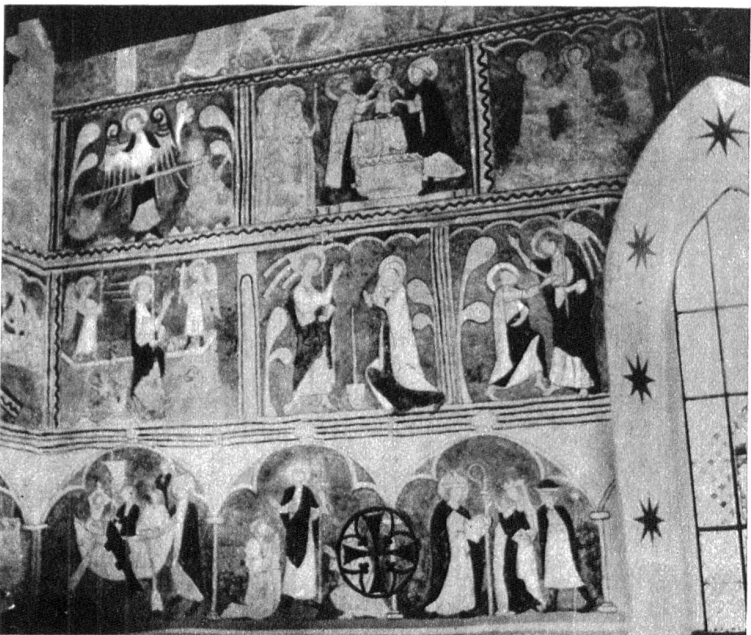
Bei Restaurationsarbeiten in der Kirche von St. Niklausen im Kanton Obwalden wurde ein Zyklus mittelalterlicher Fresken aus dem Jahre 1370 freigelegt. Sie gehören zu den wertvollsten Bilderreihen der gesamten deutschen Schweiz