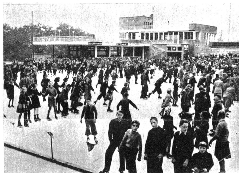
Am letzten Samstag wurde die Kunsteisbahn Ka-We-De eröffnet, die dieses Jahr ihr zehnjähriges Bestehen feiert. Unser Bild zeigt den regen Betrieb am Eröffnungstag