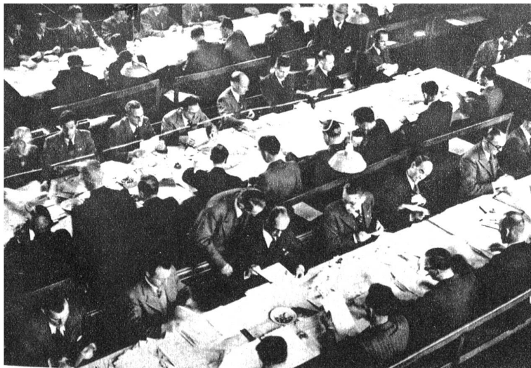
Nach den Wahlen herrscht in den Wahlbüros beim Auszählen der eingelegten Stimmzettel eine emsige Tätigkeit, die sich auf mehrere Tage und Nächte erstreckt. Unser Bild zeigt diese Arbeit in Bern, wo nicht weniger als 13 verschiedene Listen eingelegt wurden und 33 Nationalratssessel besetzt werden mussten.