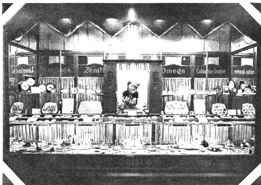
1926 Das Schaufenster aus der Zeit 1920—1925. Dieses ist schon sehr viel sachlicher gestaltet, mit einem werbenden Motiv als Mittelpunkt. Geometrische Formen herrschen etwas hart vor, doch strenge Gruppen lassen die Ware sehr gut hervortreten. Gut eingegliederte Textplakate wirken werbend

Die Zeit verändert alles und verwandelt die Gegenwart in die Vergangenheit, das Neue in das Alte, und nur, was wirklich gut und wertvoll erschien, konnte die Zeit überdauern. Was wir aufgebaut und geschaffen haben, konnte nur auf den Fundamenten des Gewesenen geschehen, und nur die Geschichte vermag über die Entwicklung ein klares Urteil abzugeben. Die Berner Lauben überdauerten Epochen und Schicksale, und unter ihren Bogen spielte sich ein Kommen und Gehen ab, von dem doch Spuren übrigblieben. Es äussern sich geschichtliche Tatsachen auf verschiedene Weise, und so erscheint uns die Art, den Werdegang eines Geschäftshauses durch die zeitentsprechende Wandlung ihrer Schaufenster wiederzugeben, originell und verdient Beachtung.