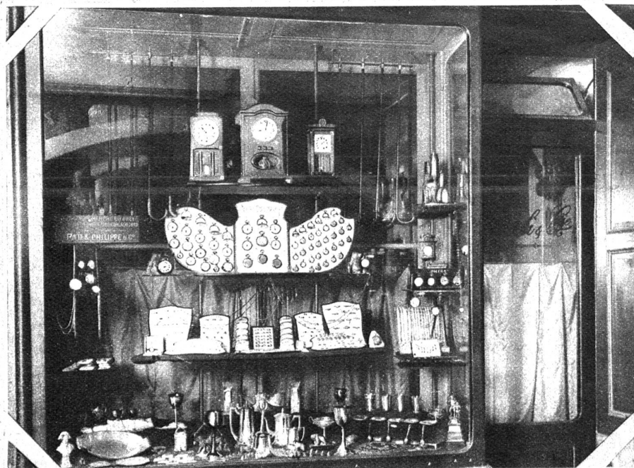
1908 Das Schaufenster aus der Zeit des Jugendstils. Es ist vom Boden bis zur Decke total ausgefüllt mit Ware. Der Kauflustige findet alles, was zum Verkauf kommt, im Fenster zur Wahl. Der Auskleidung der Rückwand und Seitenwände wurde gar keine Aufmerksamkeit geschenkt