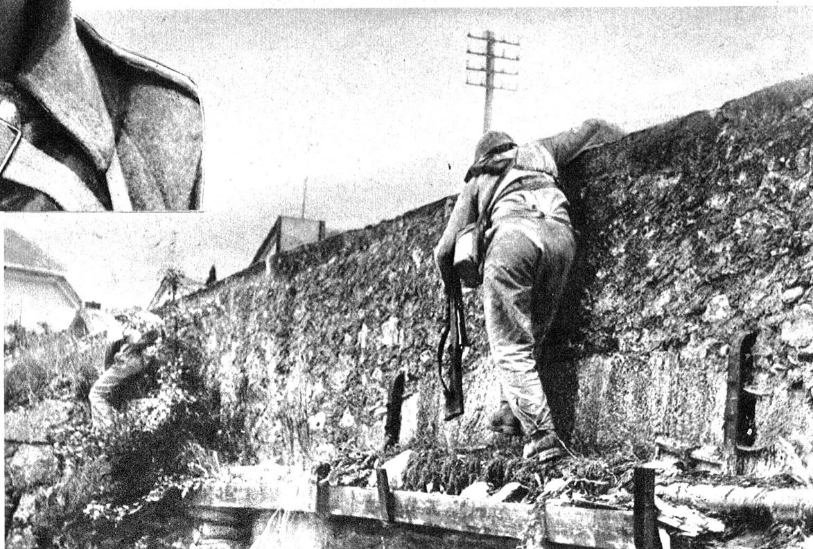
Zens.-Nr. NV 12163 und 11869