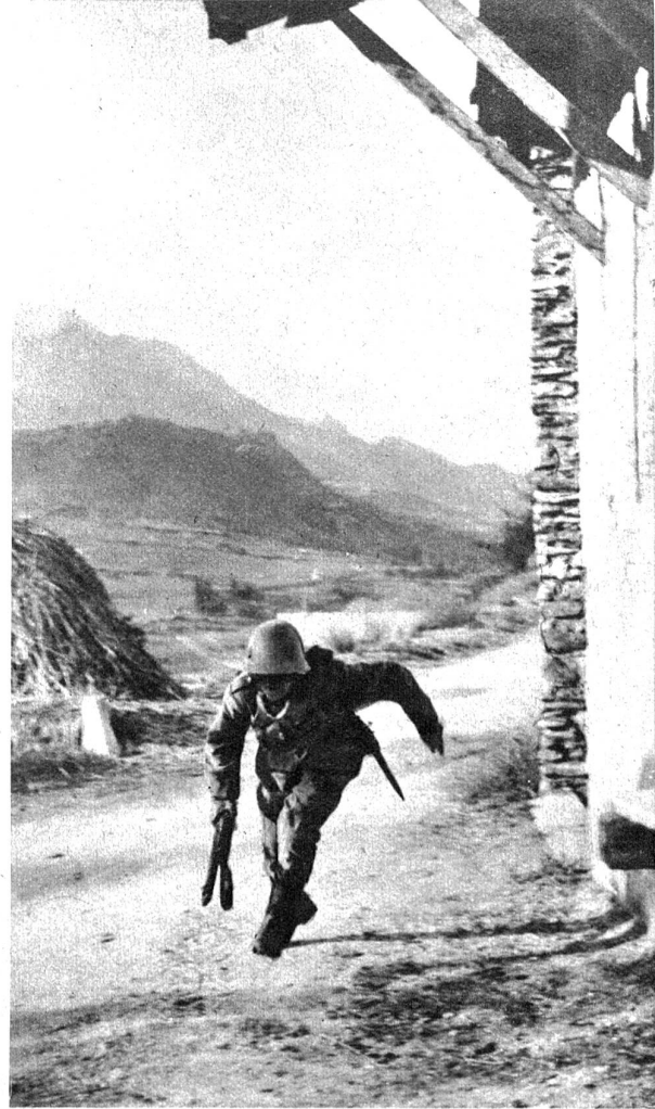
In Sekundenschnelle aus der Deckung eines Scheunentors in die nächste Deckung — so wird Haus um Haus abgesucht, ohne dass ein Feind viel Möglichkeiten hätte, ihn einzusehen Zens.-Nr. NV 12030