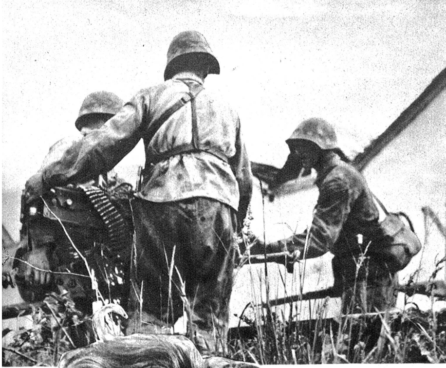
Das bereits ans Feindufer gebrachte Mg. muss vorverlegt werden und wird nun von kräftigen Fäusten gepackt, um nach rechts vorn gebracht zu werden, wo es die ganze Strasse beherrschen kann. Zens.-Nr. NV 12128