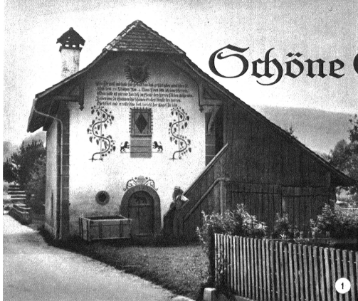
Steinerne Speicher mit Ofenhaus in Riggisberg (Rudolf Pulver). Dieser formschöne und durch Malerei reich verzierte Speicher wurde letzthin mit Hilfe des Berner Heimatschutzes kunstgerecht aufgefächert

Wenn von Speichern die Rede ist, so denkt man in erster Linie an das Emmental. Es ist sicher, dass dort die mannigfaltigsten, die interessantesten und auch die wertvollsten dieser «Schatzkästlein» des Berner Bauernhofes verstreut sind. Aber auch die übrigen Teile des Bernerlandes, wie Seeland, Mittelland, Guggisbergerland und Seftigland, das Gebiet des Gürbetals, weisen viele schöne und eigenartige Speicher, oft wahre Kunstwerke auf. Im Gürbetal, das reich ist an