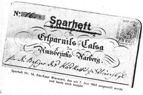
Sparheft Nr. 16, Kas-Kessi Wierzewski, das am 7. Juni 1843 ausgestellt wurde und heute noch besteht

anlasse den Kassier, entgegen aller Uebung, einen eingehenden Vorbericht zur Jahresrechnung zu verfassen, dem zu entnehmen ist, dass der Verlust ganze 113 Franken und 59 Rappen betragen hat, wogegen die Jubilaren damals schon ein Reilvermögen von Fr. 25 335.07 besaßen. Als weiterer Schritt der Entwicklung gilt die Umwandlung der Amtersparnkasse in eine Genossenschaft. Innerlich in jeder Hinsicht gestützt trat die Amtersparnkasse Aarberg mit der konstituierenden Generalversammlung vom 4. Dezember 1887 nunmehr in der Rechtsform der Genossenschaft vor ihre treuen Kunden und Anhänger. Nach weiteren 16 Jahren unermüdlicher Arbeit wurde ein eigenes Kaasgebäude im Städtchen Aarberg errichtet, in dem am 30. Dezember 1904 die erste Vorstandssitzung stattfand. In diese Zeit fällt auch die Gründung der Filiale in