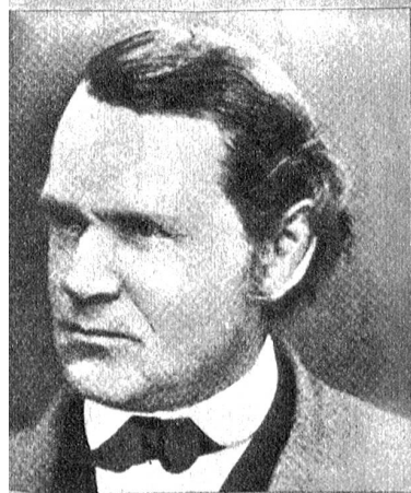
Nikolaus Bucher, Präsident 1872 bis 1881; von 1868 bis 1877 Gerichtspräsident und von da an Regierungstatthalter des Amtsbezirks Aarberg