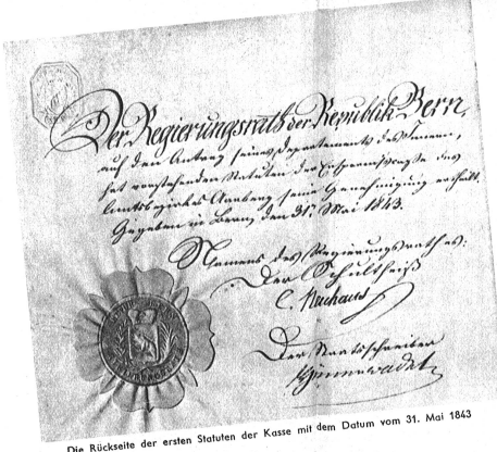
Die Rückseite der ersten Statuten der Kasse mit dem Datum vom 31. Mai 1843

Schüpfen, die am 1. Juli 1904 mit ihrer Arbeit beginnen konnte. Von diesem Zeitpunkte an bis auf den heutigen Tag zeigt die Erfolgsergebnisse der Ersparnkasse eine deutlich ansteigende Tendenz, die sich auch in schwersten Zeiten zu behaupten vermochte. Unaufhaltsam gehen Zeit und Entwicklung weiter. Rasch ist die Schwelle zum zweiten Jahrhundert überschritten. Was einmal das Werk einiger weniger Initiativ Männer war, entwickelt sich mehr und mehr zum Zeugniss menschlichen Lebens, aber nicht dem Einfluss menschlichen Wirkens. Im Gegenteil, wie in der Vergangenheit jedes Jahr und Jahrzehnt der Entwicklung der Jubilaren den Stempel der leitenden Männer trug, so ist es in der Gegenwart und wird es in Zukunft bleiben. Möge es der Jubilaren vergönnt sein, im zweiten Jahrhundert ihres Wirkens ihre gemeinnützige Tätigkeit mit gleichem Erfolg fortzusetzen!