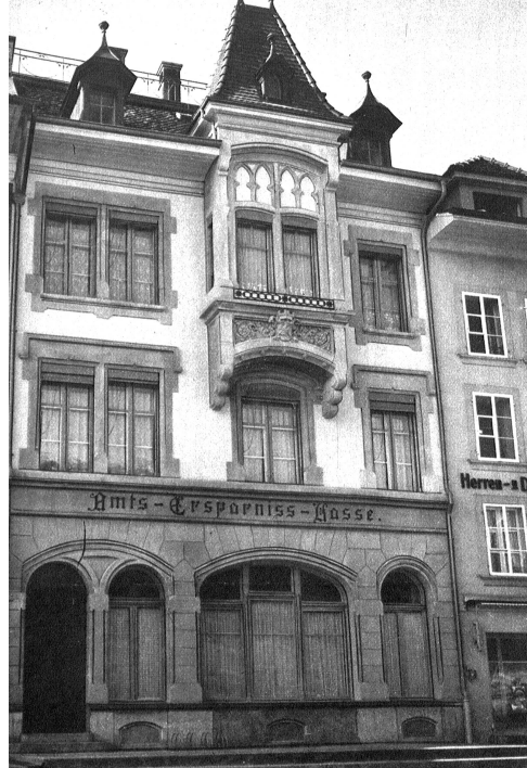
Das Gebäude der Amtersparnkasse in Aarberg