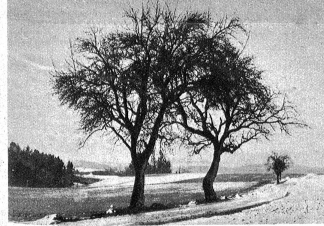
So soll es nicht sein. Diese Obstbäume schaden dem Landwirt, mehr als sie nützen und werden entfernt.