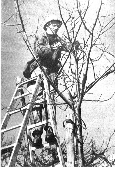
Ein Baumwärtin an der Arbeit. Vor allem handelt es sich um fachgemässes Schneiden der Bäume, ein Gebiet, in welchem die letzten Jahre erfreuliche Fortschritte gebracht haben.