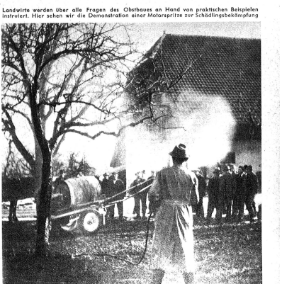
Landwirte werden über alle Fragen des Obstbauers an Hand von praktischen Beispielen instruiert. Hier sehen wir die Demonstration einer Motorspritze zur Schädlingsbekämpfung.