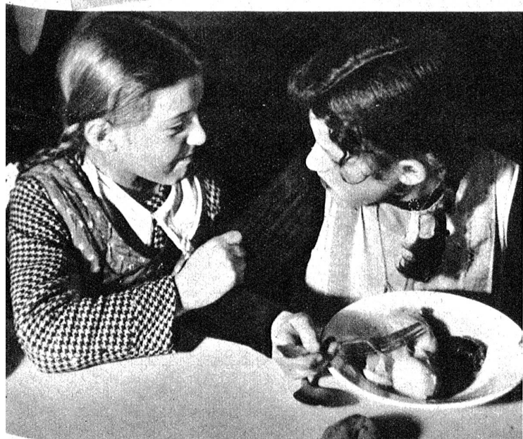
Daneben werden die letzten Neuigkeiten aus der Schule besprochen und fast ist das Essen darüber kalt geworden.