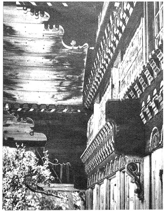
Pfetten und Frieße am „Jägerhaus“