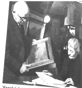
Vergleiche mit den Angaben in den Handbüchern und Ausführungen von Experten ermöglichen eine zuverlässige Feststellung von wertvollen Bildern.

Rechts: Bei der Aufstellung des Auktionskataloges muss die Beschreibung der Bilder nicht nur nach dem Aeussern, sondern auch an Hand der Kunstliteratur vorgenommen werden. Das Bild — Leopold Roberts: „Der alte Hirte“ — ist eines der bedeutendsten Werke der Auktion. — Links: Die Bildgrösse muss exakt aufgeführt werden. Sie dient als Unterlage für eine genaue Bezeichnung.