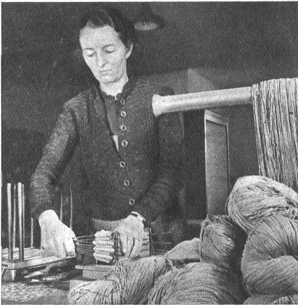
Die Strangen kommen in die Packerei und werden mit Strangenbändern versehen

In der heute so schweren Zeit, in der das Rohmaterial überall knapp wird, bedeutet jeder Textilfaden für unsere Volkswirtschaft reines Gold. Die Zwirneri in Burgdorf ist eine der ältesten ansässigen Betriebe und verdankt ihren Aufschwung der Arbeit von mehreren Generationen. Das Unternehmen ist bestrebt, mit dem zur Verfügung stehenden Material und den neuesten maschinellen Einrichtungen die zweckmässigsten Garne für das Wohl der Allgemeinheit zu fabrizieren