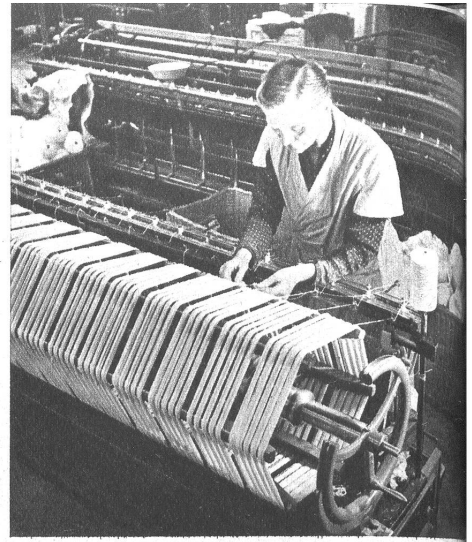
Von der Zwirnmachine wird das fertige Garn gehaselt