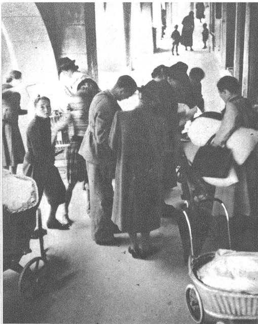
Sorgsam wird Korb für Korb und Sack für Sack an der Postgasse abgeladen.