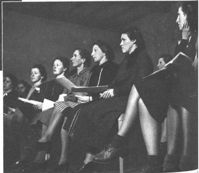
Andächtig lauschen die Kursteilnehmerinnen den Ausführungen der Leiterin und beobachten gespannt — „wie es gemacht wird“