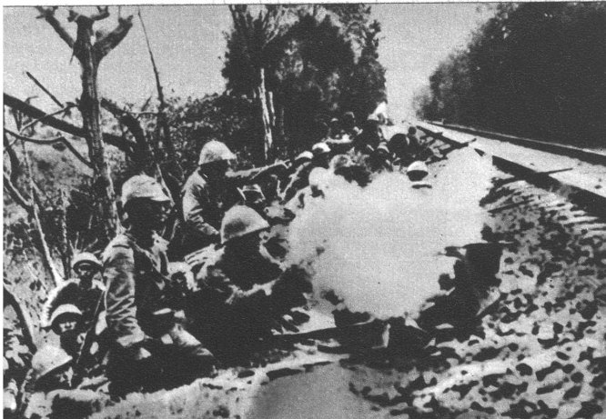
Japanische Infanterie im Angriff