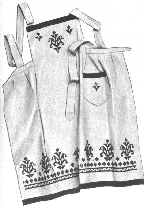
Schürze, Repsstoff, beige mit braun garniert, Kreuzstichbordüre in rost und braun Similan gestickt