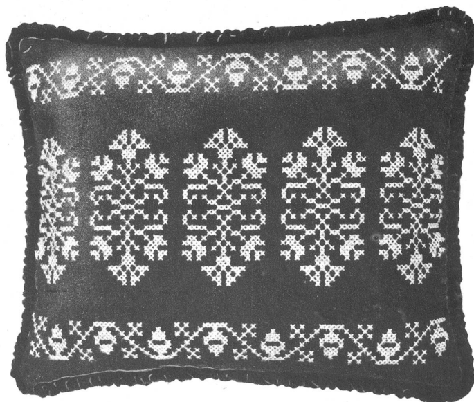
Rechts: Kissen, dunkelbrauner Wollstoff mit Bündner Bordüre in beige Kreuzstich