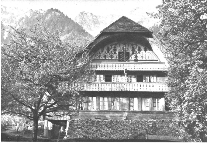
Das Schenkhäusli in der Bachtelen bei Pohlern, nach der Erneuerung des Farbschmuckes. Im Hintergrund die Stockhornkette mit dem „Chinageli“

Es war an einem sonnigen Maimorgen, als ich am Fusse der Stockhornkette nach neuen Schönheiten der alten Bauenbaukunst suchend, der Pohlern zu wanderte. Nahe am Pilgerweg zwischen Blumenstein und Pohlern leuchtete zwischen Apfelbäumen ein silberhelles Schindeldach auf. Ein eleganter Gerschuld auf der Vorderseite, darunter eines „Ründli“, ja, das war ja das Uebliche in dieser Gegend. Aber halt, dieser zierliche Bogen, diese schönen Laubenschmucke, der leichte Knick in den Dachflächen, da schien doch etwas Besonderes los zu sein! Schon stand ich davor. Es war ein schön proportioniertes Holzhaus mit zwei prachtvollen Lauben, mit einem überaus eleganten Pfosten zwischen der obren Laube und dem Bogen, gut erhaltenen Fensterpföstchen, und einer sehr schönen Schrift über den Fenstern des unteren Ringes (1). Ich trat hinzu etwa wie ein Goldgräber an das Bachbett, in dem er soeben einen leuchtenden Goldklumpen entdeckt hat. Schnell war ich