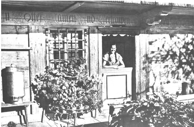
Cläri in der querteilten Küchenüre am Sonntagmorgen. Das eisenergrünte Küchenfenster, die zierliche Form der Türstürze, die geschnitzten Pföschel zu beiden Seiten des Fensters, das alle blieb erhalten dank dem Verständnis der Bauernfamilie für alle Schönheit.

an der Längsseite des Hauses, vor der offenen Stalltüre, wo eben der Bauer mit dem Stallbesen am Stallgang die letzte Politur gab. Etwas geniert wegen seines unsontäglichen Aussehens trat er hinaus, und siehe da, nach kurzem Wortwechsel waren wir Freunde. Er rief einen Mädchennamen, und dort, wo unterdessen mein rechtes Auge nach der querteilten Küchenüre mit dem schönen Türsturz hingesehelt hatte, dort erschien ein frisch-gewaschenes Meiteli und grüsste freundlich (2). Der Vater befahl ihm, mich an seiner Stelle durch Einfahrt und Säller auf die obere Laube zu führen, wo ich etwas photographieren wollte. Wie schön dieser Laubepfosten dastand, mit seinem achteckigen Kapitäl, dem zierlichen Unterbruch in der Mitte! Und, war es Täuschung? Farben am Pfosten? Ja, es war so, am Kapitäl noch wohl erhalten, an den untern Teilen aber arg verblichen, waren überall Farbreste zu sehen (3). Und nun die „Ründli“! Sonne, Mond und Sterne leuchteten friedlich in das Stockental hinaus. Aber da kamen neue Sachen zum Vorschein. Waren da nicht an der Stirnwand überall Farbreste schwach sichtbar? Waren