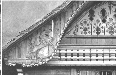
Die beidseitigen Stirnwände der „Ründli“ erhielten den weit und breit üblichen Schmuck des Bären und Löwen. Hier steht der grimmige Löwe mit dem Silberschwert, den Schwanz im Wappen schirmend