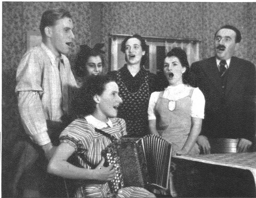
„Freut euch des Lebens“ . . . singen alle Kinder, und kräftig setzen die Mutter und der Gast, Cornellis Vater, ebenfalls ein, — denn sie alle haben Grund, sich über die Wendung der Geschichte zu freuen.