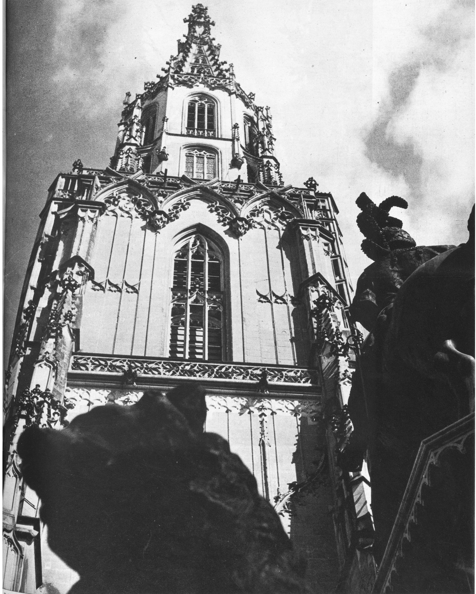
Feierlich läuten die Münster Glocken den Betttag ein und mahnen zum Glauben, zur Hoffnung und Liebe.