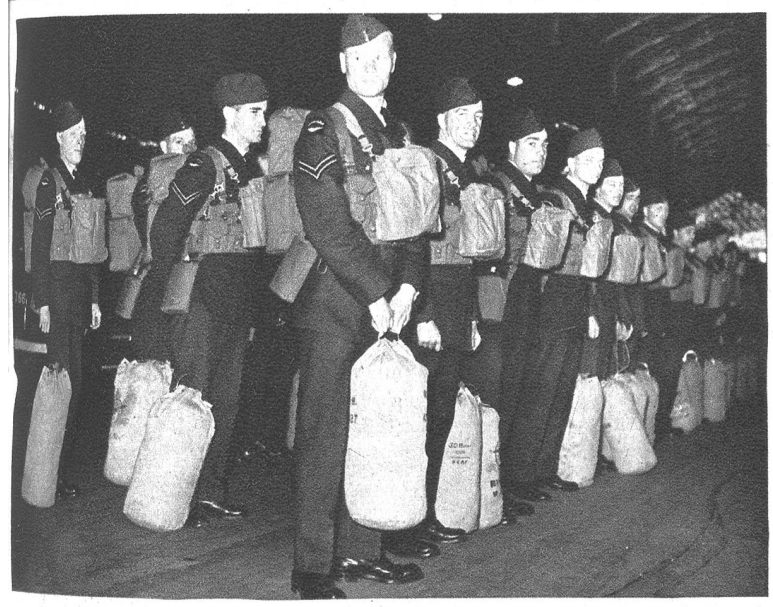
Kanadische Fliegertruppen werden ständig und regelmässig auf der Flugroute nach England transferiert.

Unten: Die Hauptstützpunkte sind Dakar im Kreis I und Casablanca im Kreis II. Man rechnet damit, dass, bevor die Amerikaner und Engländer handeln können, Deutschland den Gegenzug unternehmen kann und die Stützpunkte für sich beansprucht. Es scheint, dass militärisch beide Basen sehr gut ausgerüstet sind.