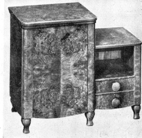
Ein formschönes Möbel besitzt die neue