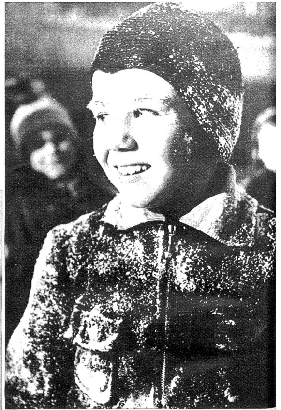
Der erste Schnee . . .