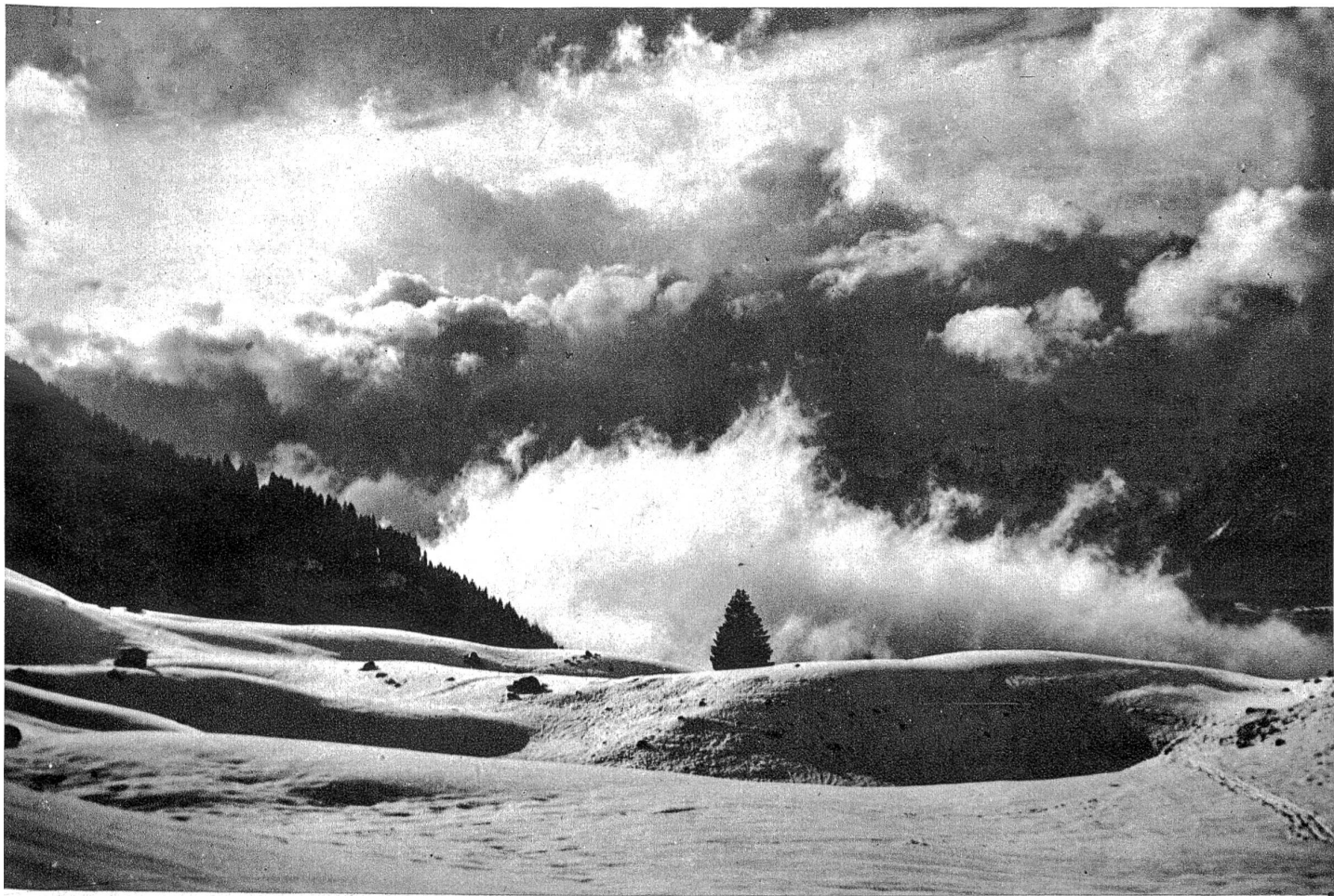
Auf dem Tschuggen im Diemtigtal. Ziehender Nebel.