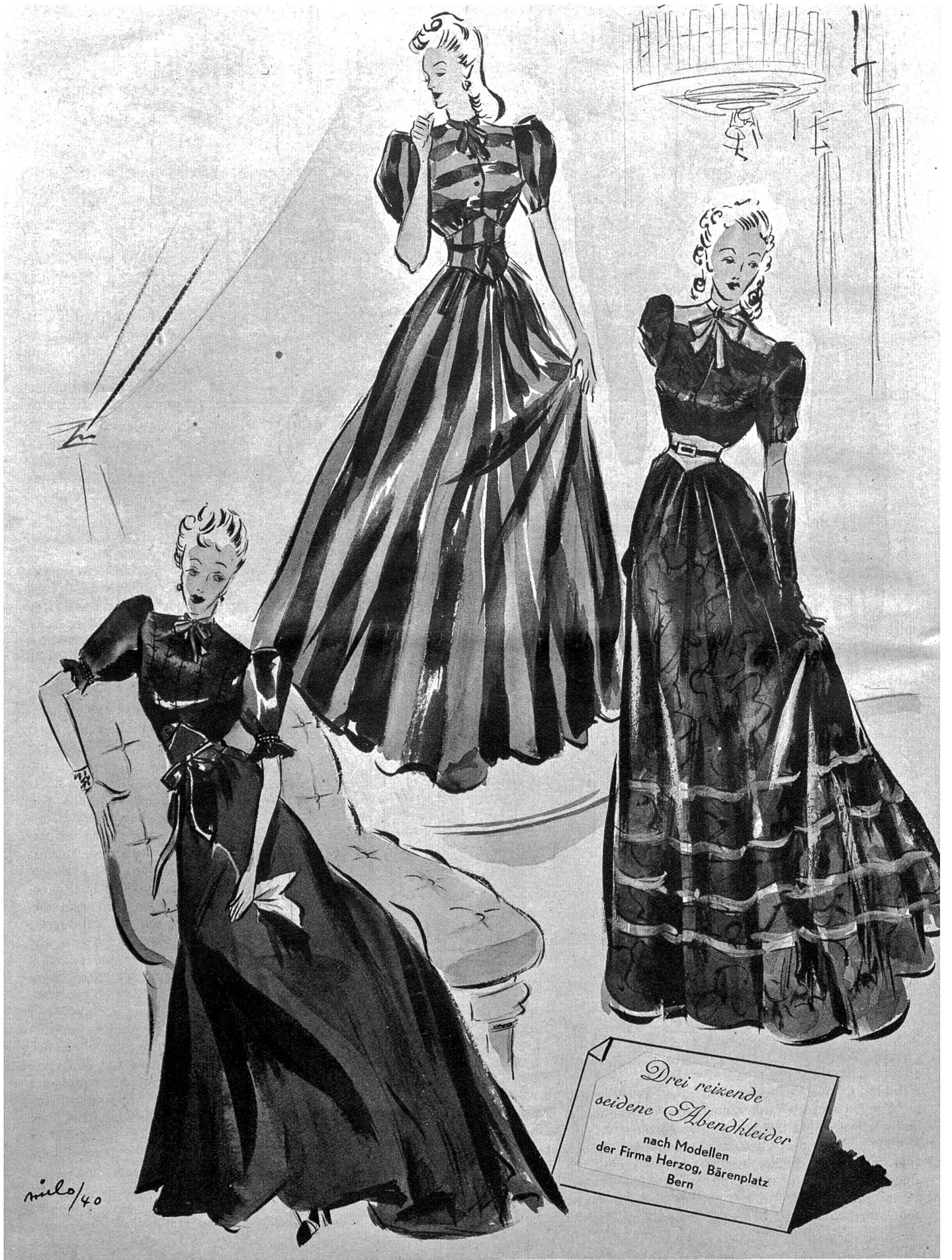
Drei reizende seidene Abendkleider nach Modellen der Firma Herzog, Bärenplatz Bern