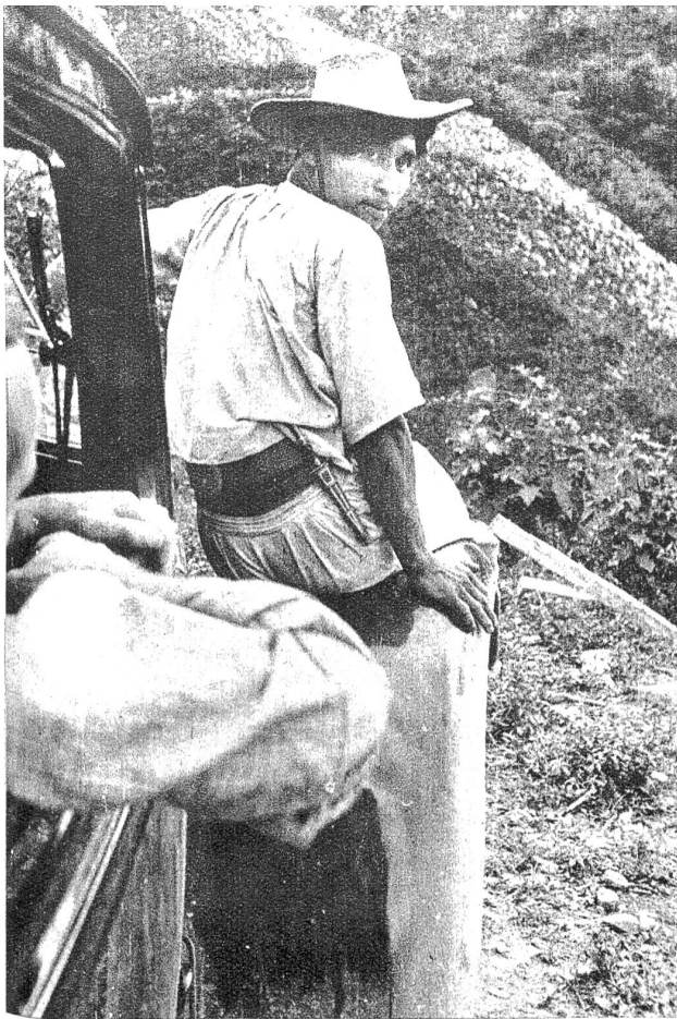
Ein eingeborener Reiseführer durch unwegsame Strassen der mexikanischen Hochebene. Er ist sichtlich stolz darauf einem Europäer die Wege seiner uralten Heimat zeigen zu können.