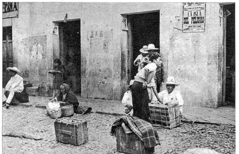
Im Gegensatz zu den Weissen lebt die Indianer- und Mischlingsbevölkerung in grösser Armut und Primitivität. Fast die Hälfte der Bevölkerung Mexikos besteht aus Mischlingen aller möglichen Schattierungen, von Weissen, Indianern und Negern, die je nach ihrem Mischungsverhältnis Mestizen, Mulatten, Zambos oder Chinos genannt werden.