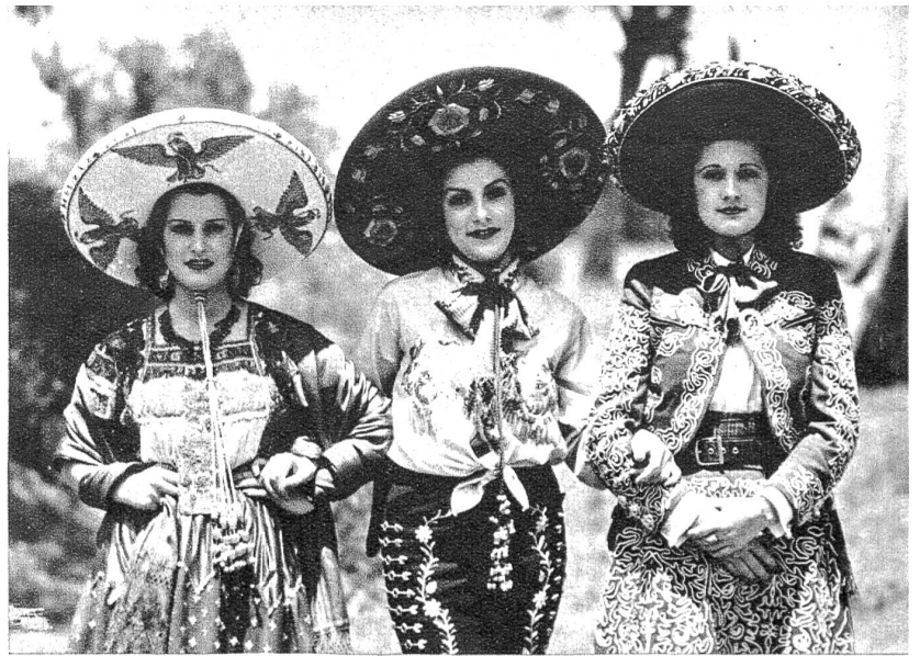
Töchter eines Haciendros (Gutsbesitzers) in ihrer malerischen, reichgeschmückten Nationaltracht — gepflegte Schönheiten, die Filmschauspielerinnen nichts nachgeben.