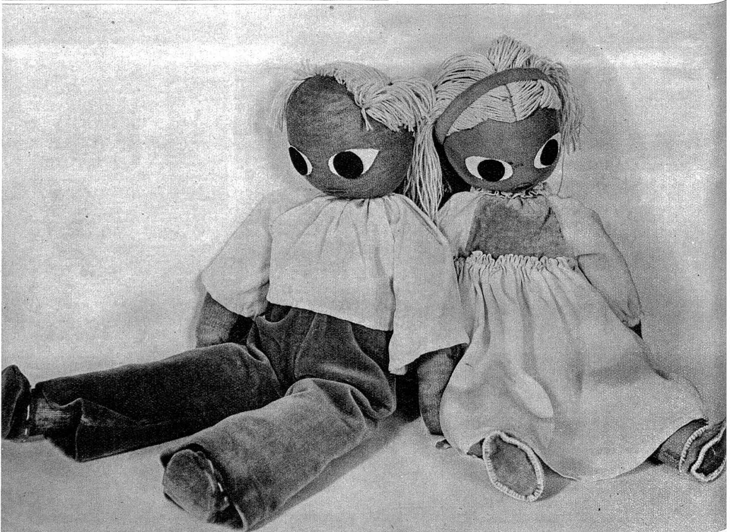
Hänsel und Gretel im Puppenreiche. Auch diese Arbeiten stammen aus unserm städtischen Kindergartenseminar.

Reizende Wollpferdchen aus geschmackvoll zusammengestellten Wollresten über einem Drahtgestell. Diese lustigen Figürchen sind etwa 10—15 cm hoch und stammen aus dem städtischen Kindergartenseminar.