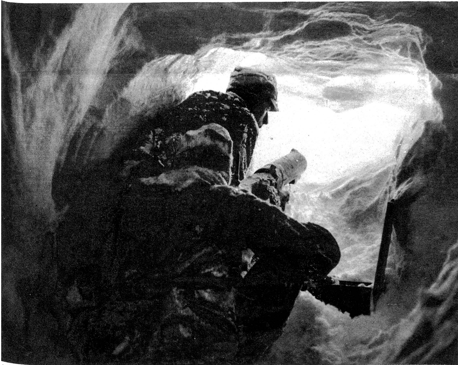
Maschinengewehrstellung in einem in Gletschereis gehauenen Stollen in 3000 m Höhe. Aus dem Film „Gränzbsetzig 1939“. (Zensur Nr. 90)