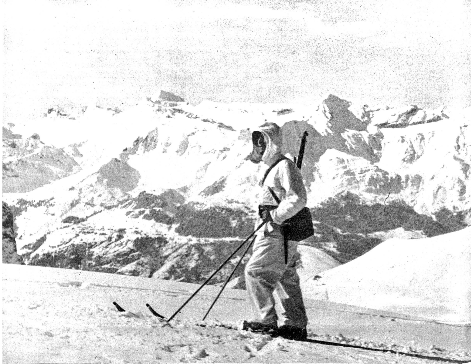
Überall wachen unsere Patrouillen! Aus dem Film „Gränzbsetzig 1939“ (Zensur Nr. 100)