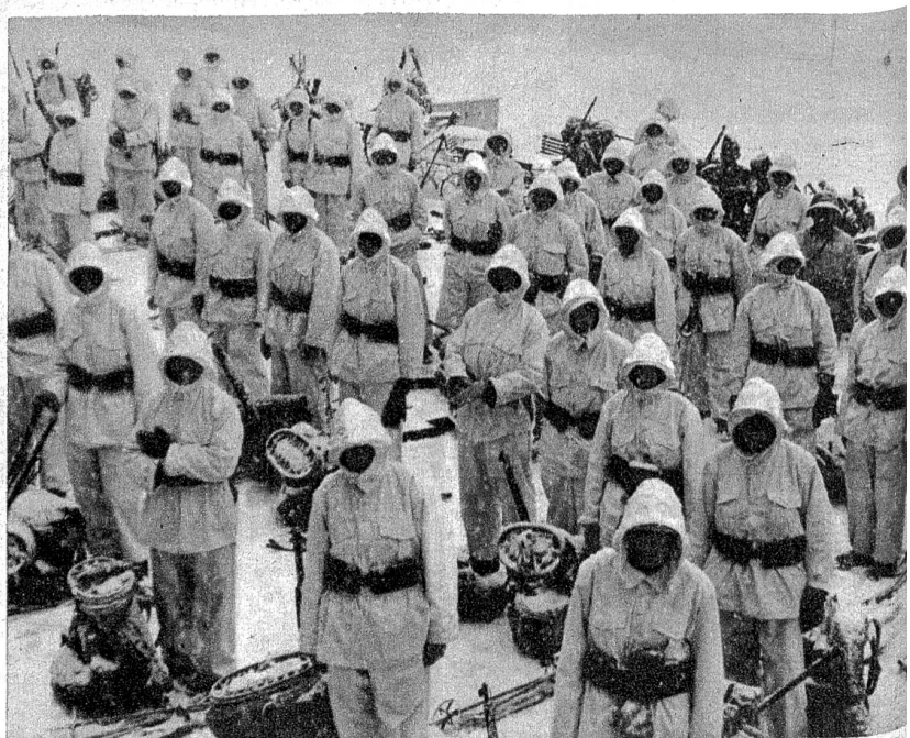
Eine wetterfeste Kompagnie. Aus dem Film „Gränzbsetzig 1939“ (Zensur Nr. 69)