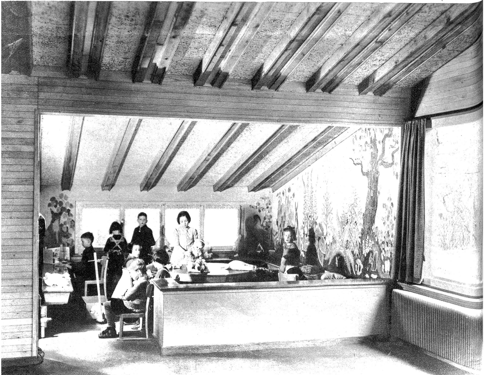
Die Märchen-Ecke (Phot. Steiner)