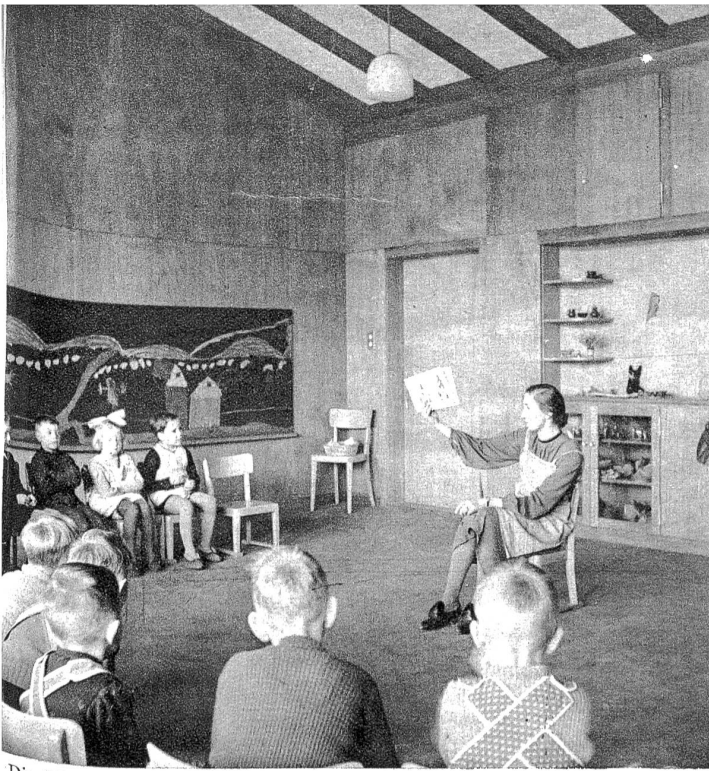
Die Märchentante erzählt Geschichten