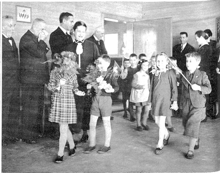
Triumphzug der Kinder bei der Einweihung.