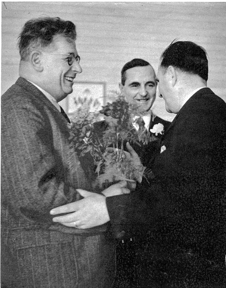
Unsere Herren Gemeinderäte freuen sich über das gelungene Werk.