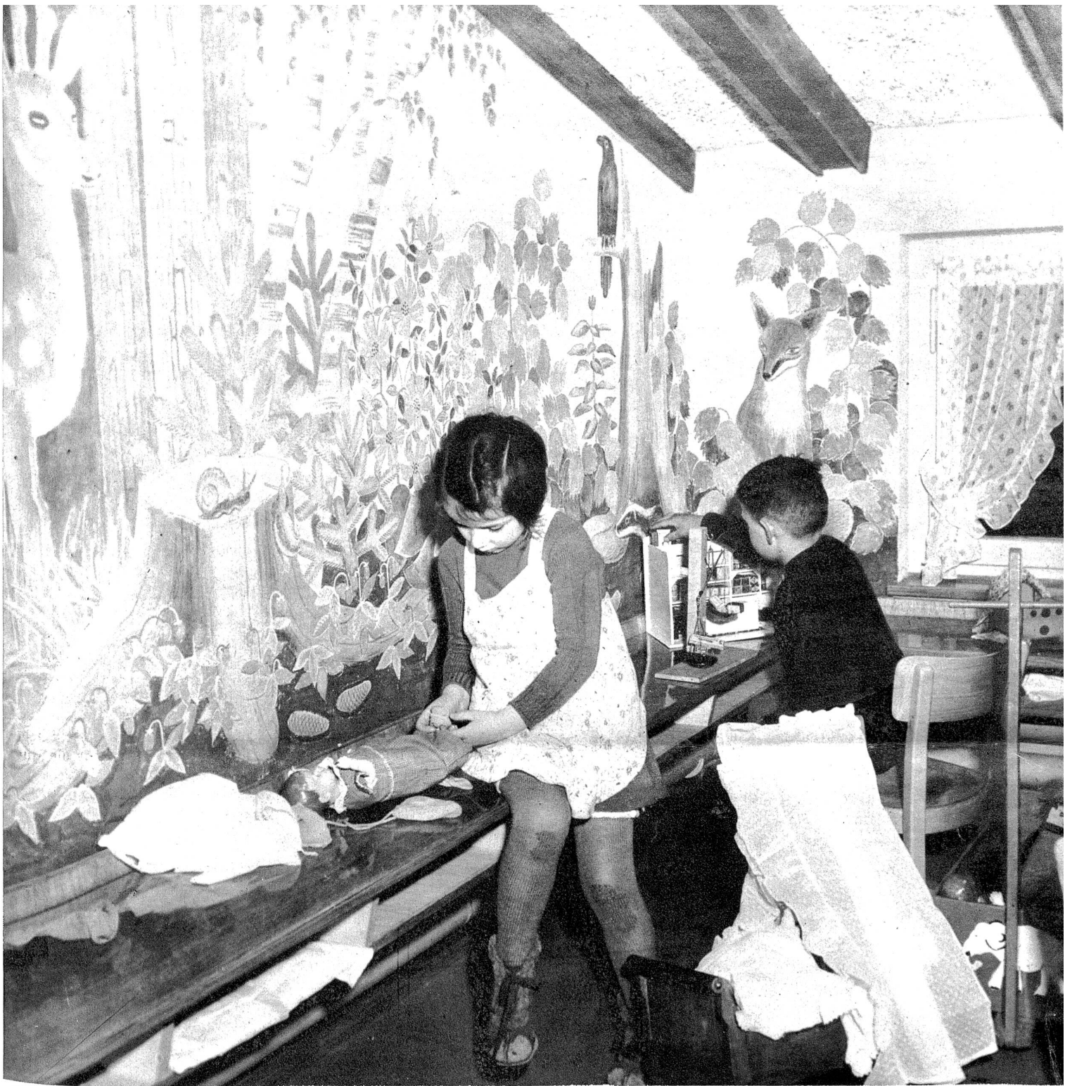
Spielende Kinder in der Märchenecke des Kindergartens.