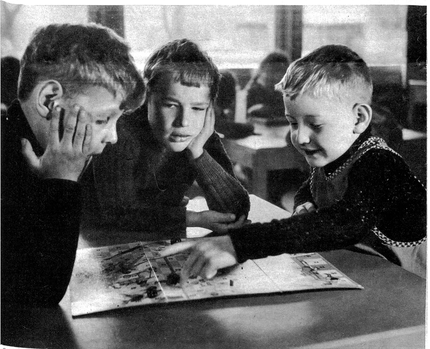
Spielende Kinder im neuen Kindergarten.