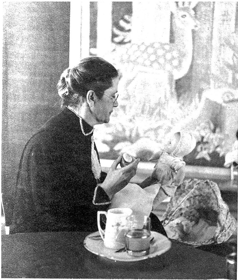
Die Leiterin des neuen Kindergartens