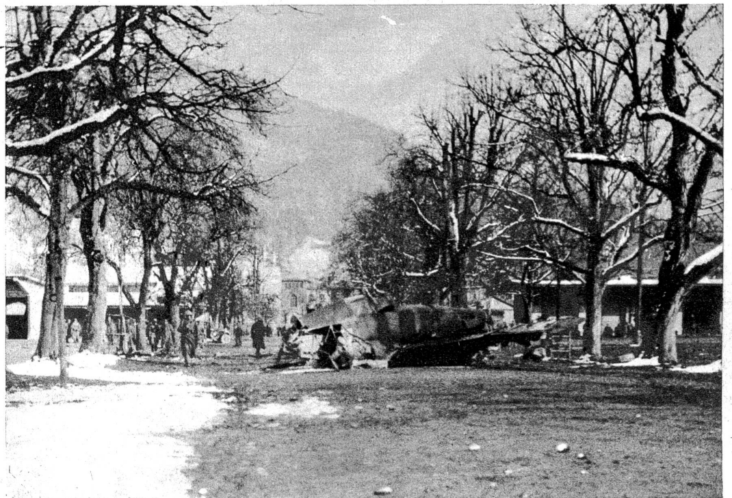
Ein Jagdflugzeug stürzt bei der Landung auf der Thuner Allmend infolge Geschwindigkeitsverlustes auf den Übungsplatz einer Artillerierekrutenschule ab. Eine Gruppe am Geschütz über der Rekruten wurde getroffen. Vier Mann wurden auf der Stelle getötet und der Fünfte starb nach der Einlieferung ins Krankenhaus. — Wir zeigen eine Aufnahme der Unfallstelle mitten in einer Baumallee. Die Maschinentrümmern des abgestürzten Jagdflugzeuges sind erkennbar. (Zensur-Nr. VI B 1176)